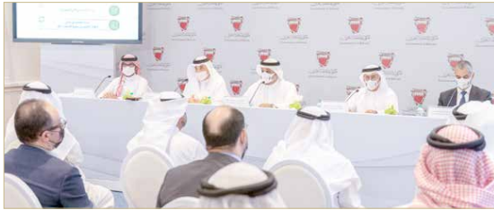
المؤتمر الصحفي للاطلاع عن خطة التعافي الاقتصادي

وأشار وزير المالية والاقتصاد الوطني في المؤتمر الصحافي الذي عقد ظهر أمس في قصر القضيبية خلال إجابته عن السؤال الثاني لرئيس تحرير "البلاد" بشأن اتفاقية التجارة مع بريطانيا، إلى أن العمل والتفاوض بدأ من خلال تشكيل فريق خليجي برئاسة وزير التجارة في السعودية، ويشمل ممثلين من البحرين وعمان في جميع دول الخليج بالإضافة إلى العمل مع دول أخرى في المنطقة. ونوه الوزير بأن مفاوضات الاتفاقية تضم العديد من الفصول وكل فصل يتعلق بمسور خاص، منها ما يتعلق بالسلع والخدمات وما يتعلق بإنشاء جزئياً أو كلياً ومرحلياً بعد سنوات معينة أو العكس إلغاء الإعفاء للسلع، مؤكداً أن الفريق الخليجي المتكامل في الأمانة العامة