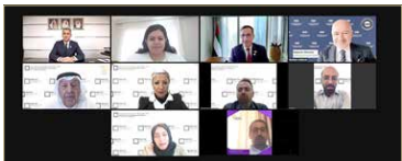
المجلس الأعلى للمرأة يشارك في الأسبوع العالمي للاستثمار العالمي

اقتصاد قائم على مبدأ تكافؤ الفرص وزيادة آفاق التطور من الحياة لتعزيز القدرة التنافسية للمرأة وتقدمها في سوق العمل، وتطبيق ذلك من خلال نموذج وطني لمحوكة تطبيقات التوازن بين الجنسين محدد المحاور أسهم منذ تعهدها في تقديم المرأة البحرينية ومد الجوانب المرصودة في جميع المجالات، وتكثرت مشاركة المجلس الأعلى للمرأة في هذه الفعاليات حرصه على تبادل الخبرات والاطلاع على أفضل الممارسات بين الدول المشاركة لتنمية قطاع ريادة الأعمال وتنمية المؤسسات الصغيرة والمتوسطة وتذليل العقبات أمامها في ظل الظروف الاقتصادية العالمية الراهنة ليؤكد دوره كمركز خبرة وطني مختص في شؤون المرأة.