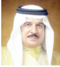
عاهل البلاد المفدى

تلقى حضرة صاحب الجلالة الملك حمد بن عيسى آل خليفة عاهل البلاد المفدى حفظه الله ورعاه اتصالاً هاتفياً من أخيه خادم الحرمين الشريفين الملك سلمان بن عبدالعزيز آل سعود عاهل المملكة العربية السعودية الشقيقة حفظه الله، عبر خلاله عن شكره لجلالة الملك المفدى على ما قامت به مملكة البحرين من إجراءات تجاه تصريح وزير الإعلام اللبناني، بما يجسد تضامناً للمملكتين، ويعكس وحدة دول مجلس التعاون الخليجي. وقد أكد جلالة الملك المفدى خلال الاتصال عمق العلاقات بين مملكة البحرين والمملكة العربية السعودية الشقيقة، وتماثل دول مجلس التعاون الخليجي، داعياً الله عز وجل أن يحفظ الشقيقة الكبرى ويديم عليها أمنها واستقرارها، في ظل قيادتها الحكيمه.