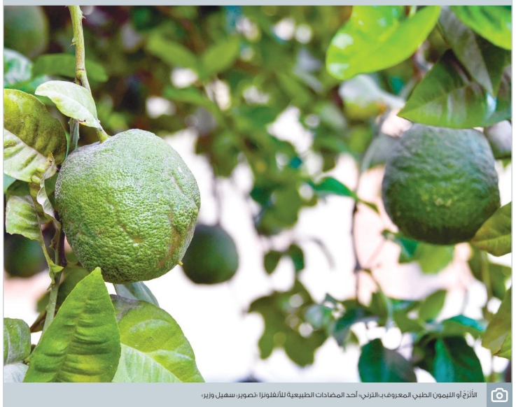
الأثر أو اللبون الطبي المعروف باللبان، أحد المضادات الطبيعية للأشرف، تصوير: سفيان وزير

الأشخاص المهتمين بالماكولات الذين يذكرون تكة وكباب أمين مطعم بحريني عربي متخصص في تقديم التكة والكباب التقليدي ويعتبر من ضمن أشهر مطاعم التكة كوربان: «حان الوقت لمزيد من المطبخ العربية لتصل إلى الحثك الهندي وستشهد البلاد مزيداً